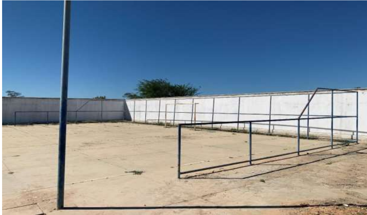
Figura 5 - ALAMBRADO