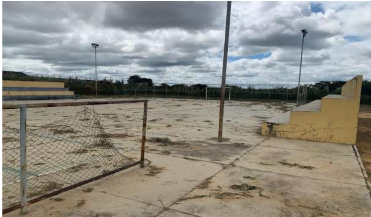
Figura 4 – PISO, ARQUIBANCADA, ILUMINAÇÃO E ALAMBRADO