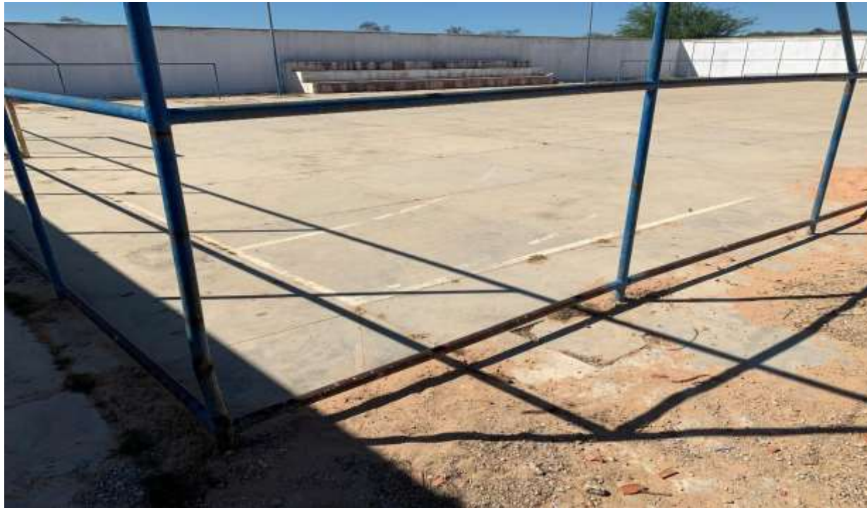
Figura 3 - ARQUIBANCADA