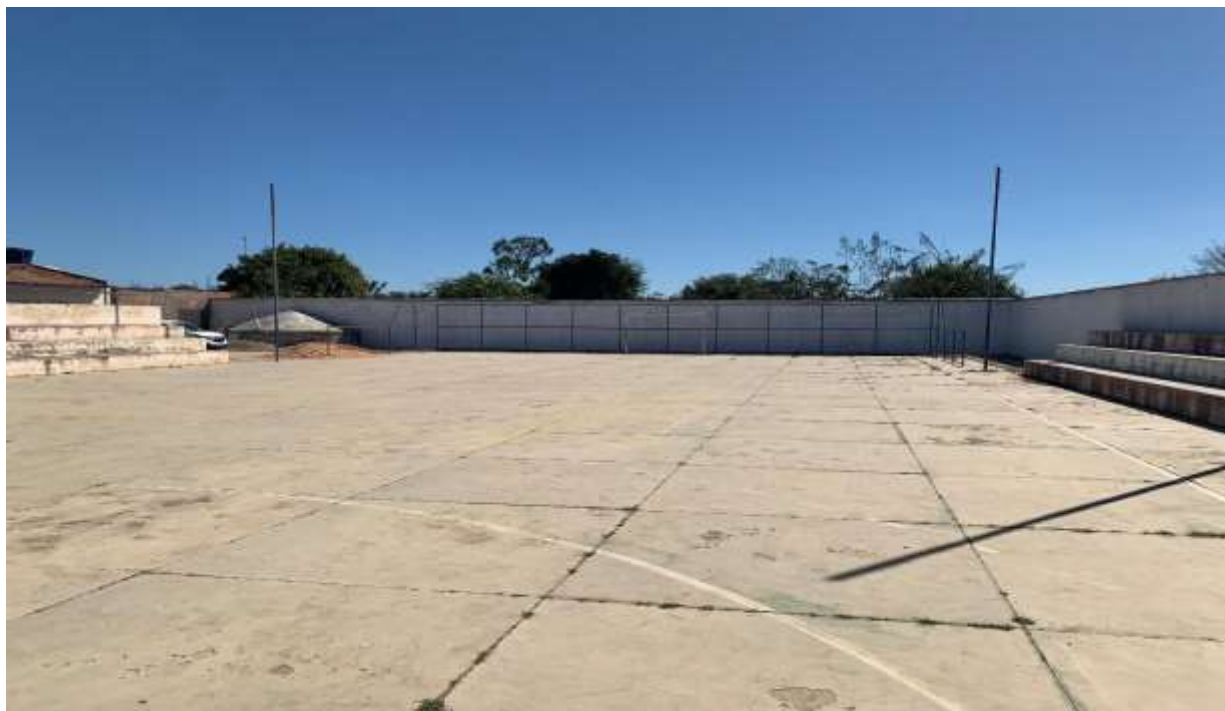
Figura 1 – PISO

Referente à Requalificação e Iluminação de Quadra Poliesportiva do Sítio Pajeú, Município de Ipubi/PE.