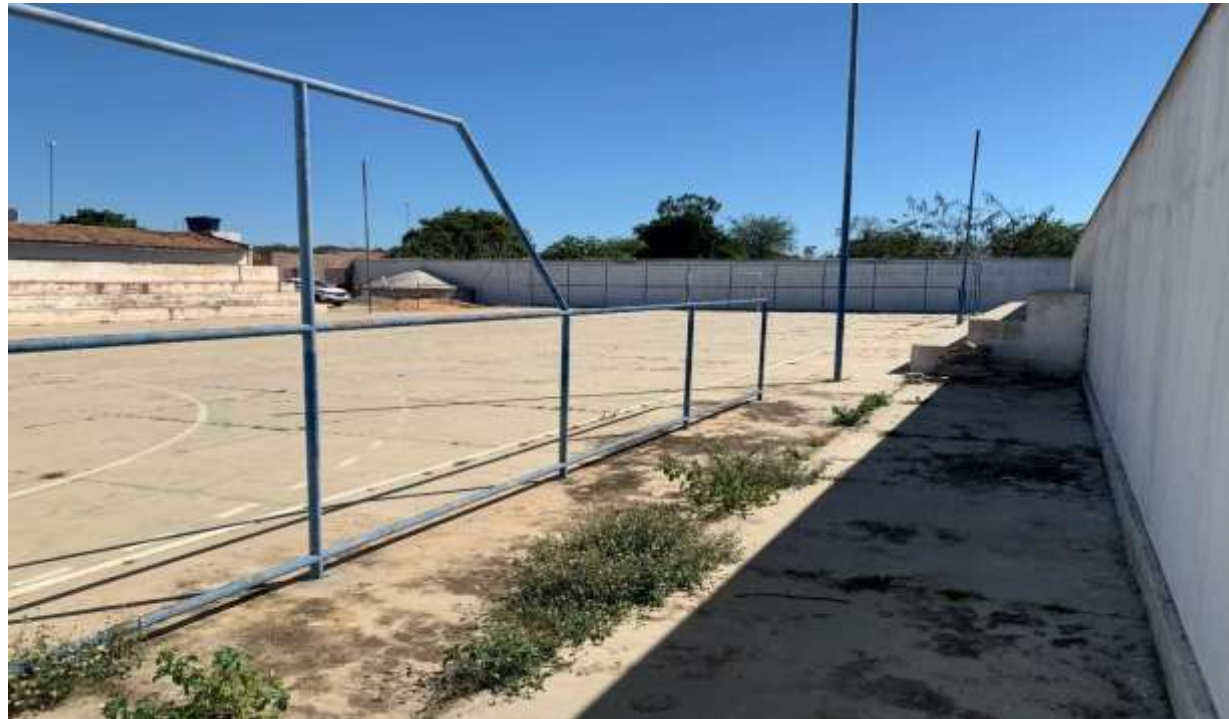
Figura 4 – PISO, ARQUIBANCADA, ILUMINAÇÃO E ALAMBRADO