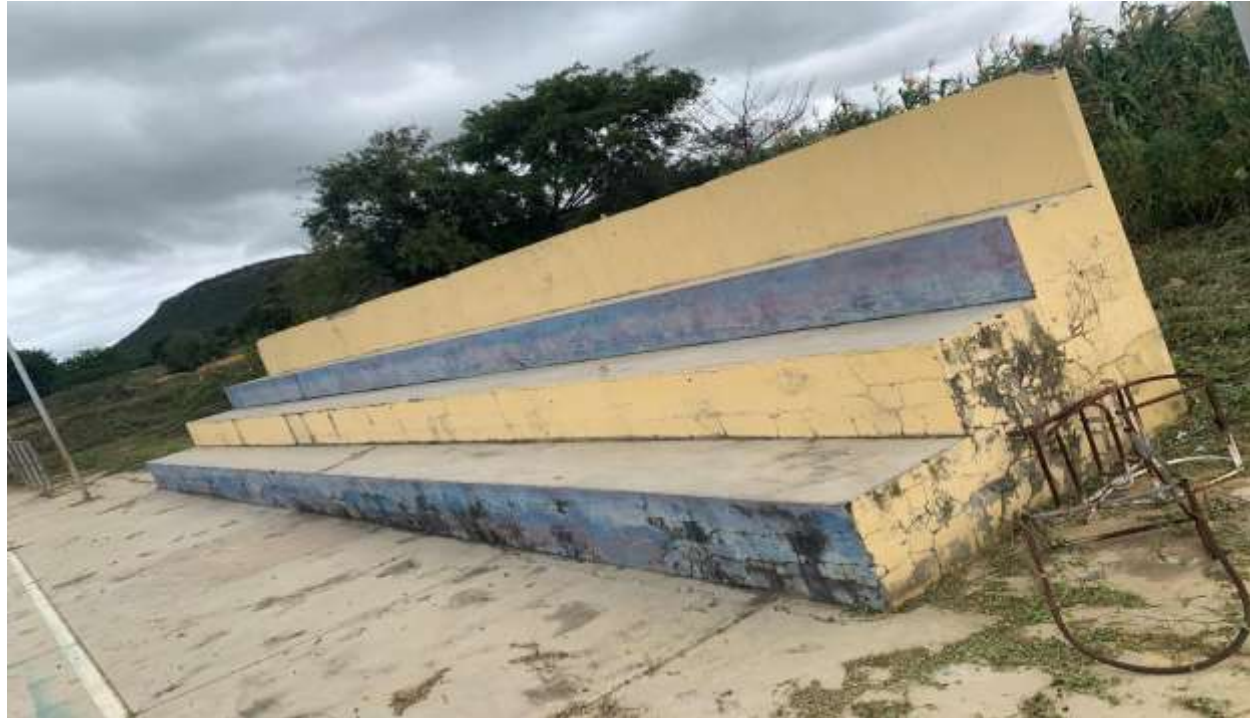
Figura 3 - ARQUIBANCADA