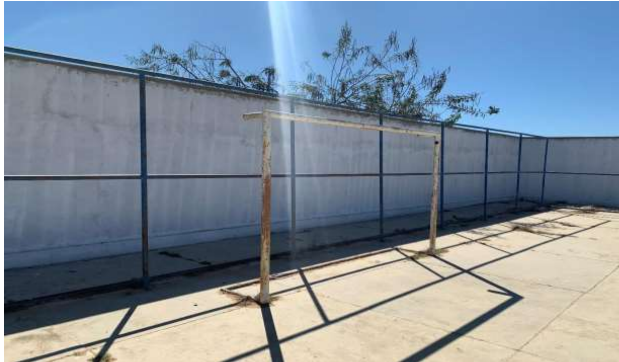
Figura 7 - FECHAMENTO PERIMETRAL EXISTENTE