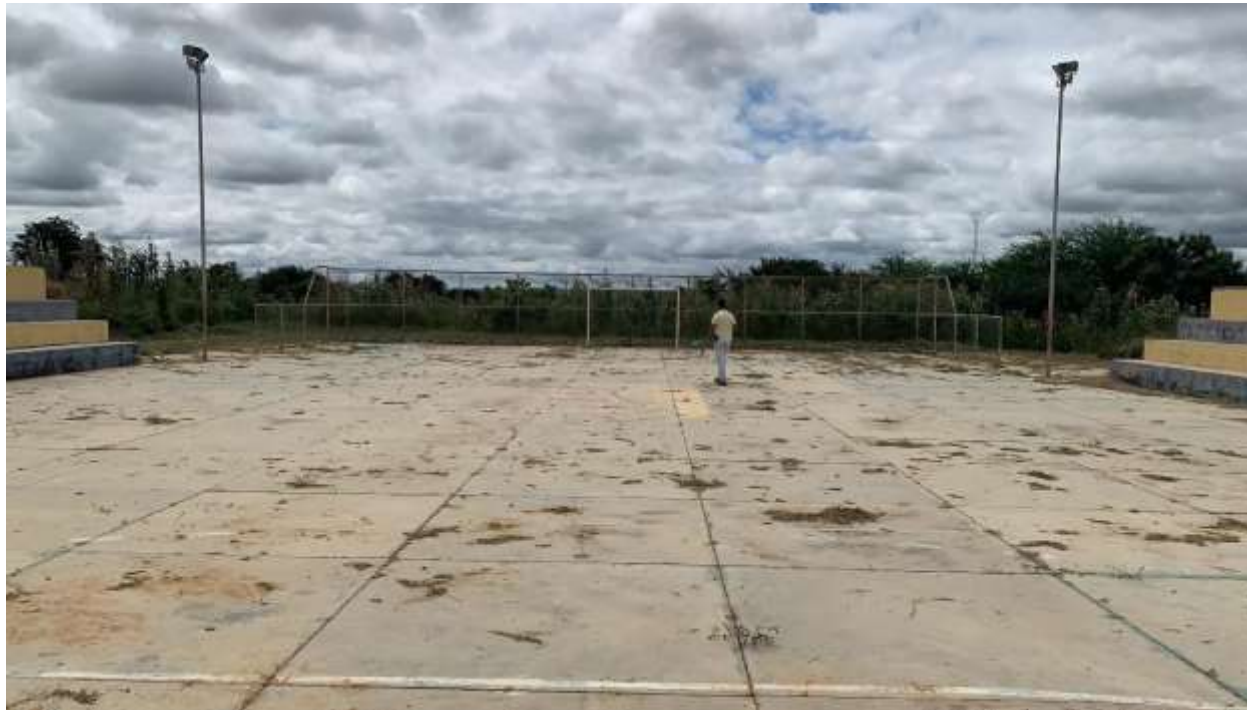
Figura 2 – PISO