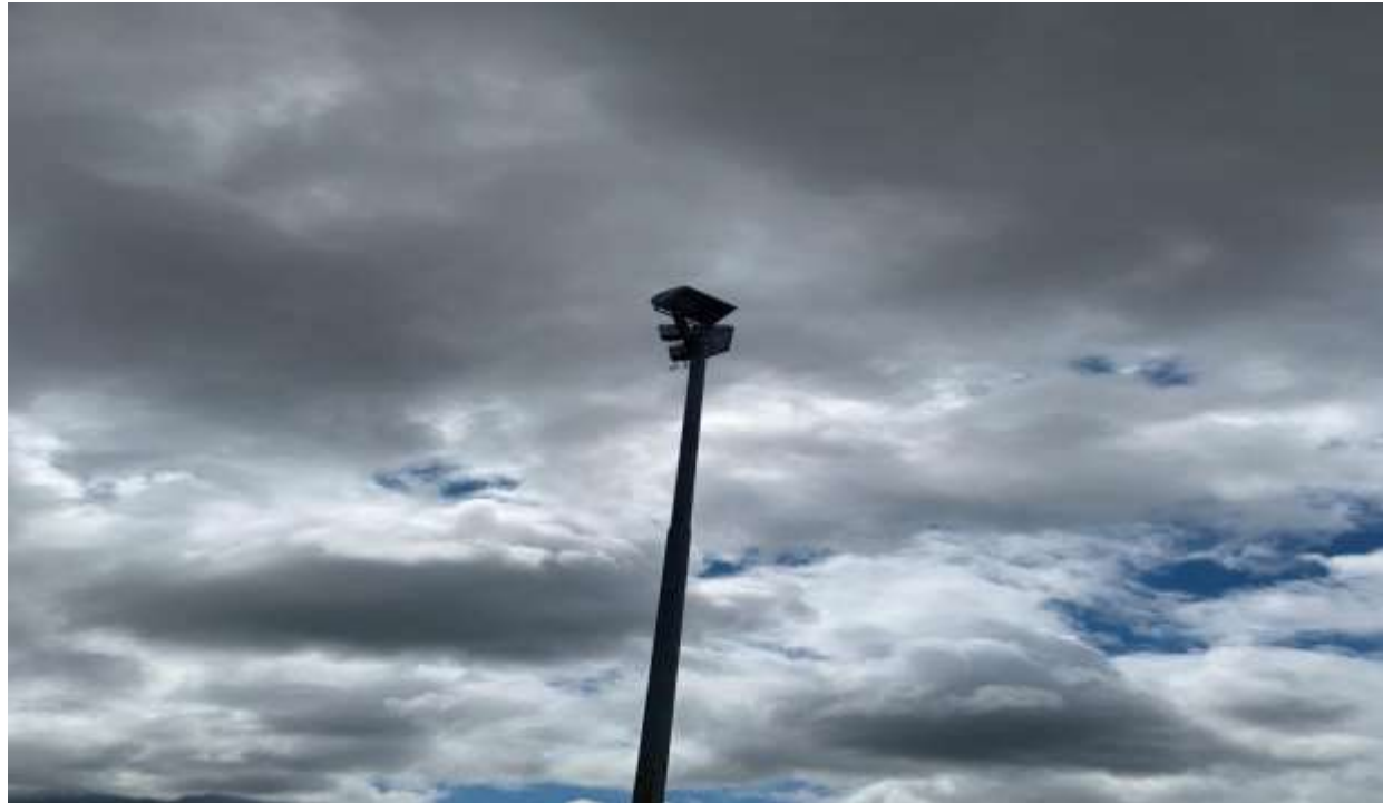
Figura 7 - ILUMINAÇÃO