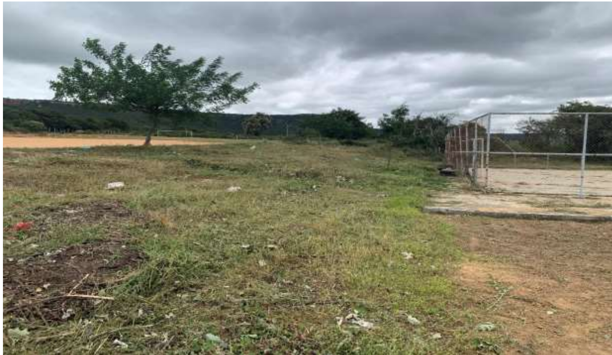
Figura 7 - QUADRA EXPOSTA