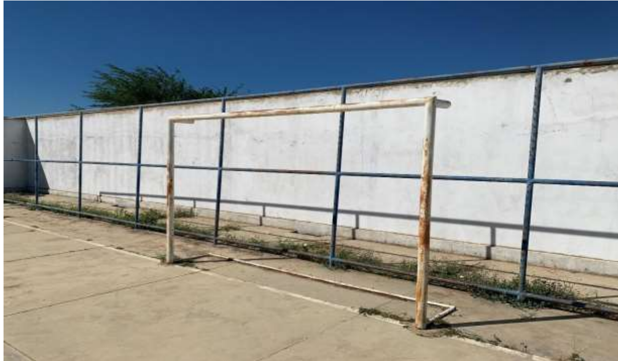
Figura 6 – FECHAMENTO PERIMETRAL EXISTENTE