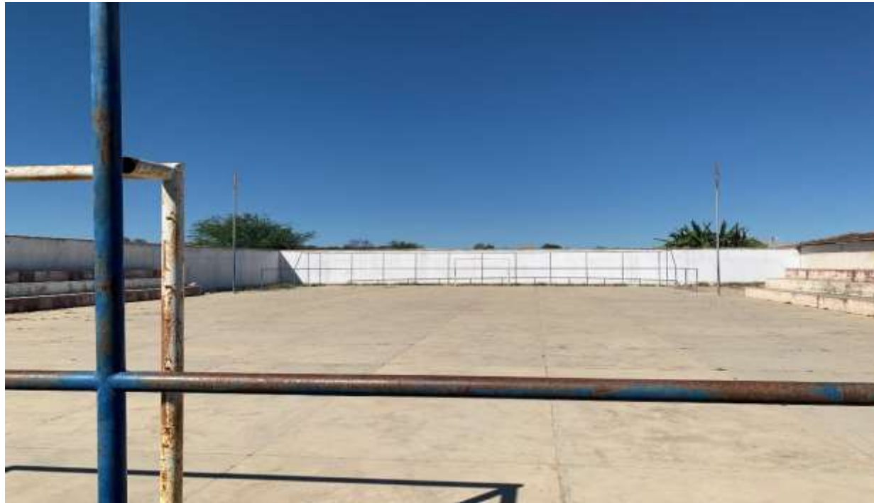
Figura 2 – PISO