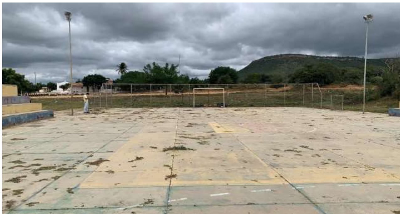
Figura 1 – PISO

Referente à Requalificação e Cobertura de Quadra Poliesportiva do Sítio Torre, Município de Ipubi/PE.