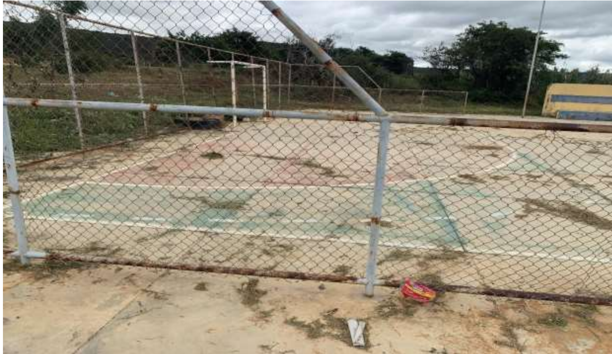
Figura 5 - ALAMBRADO