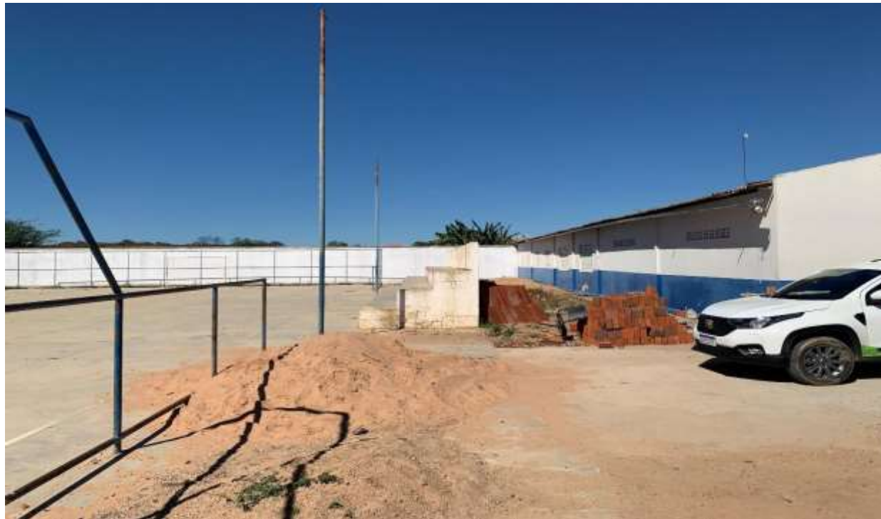
Figura 7 - PISO, ARQUIBANCADA, ILUMINAÇÃO E ALAMBRADO